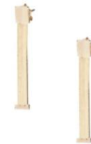
Goldie Earring €209,00